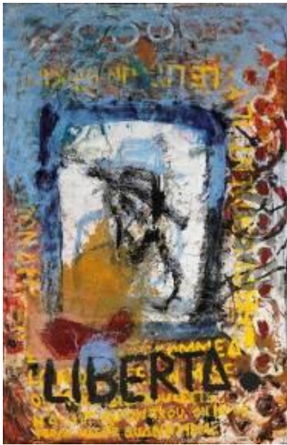
< 1 Liberta Pigments sur toile 475 x 315 cm