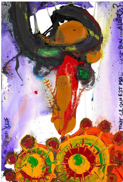
3 > Série Les Taureaux, 2 2006 Pigments sur papier 154 x 104 cm