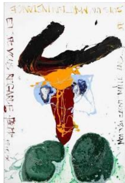
< 4 Série Les Taureaux, 6 2006 Pigments sur papier 154 x 104 cm