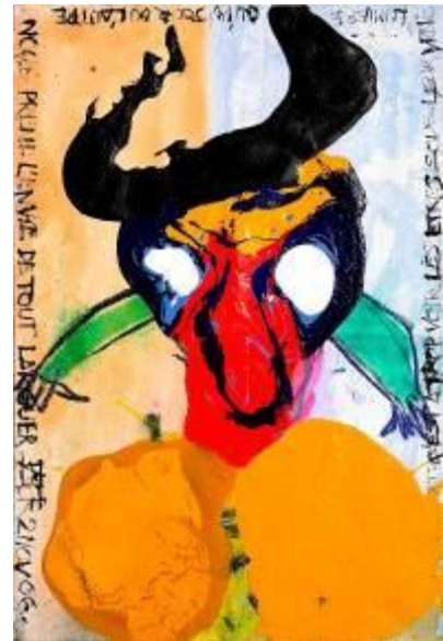
2 > Série Les Taureaux, 1 2006 Pigments sur papier 154 x 104 cm