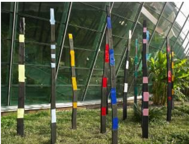
Aéroport de Nice Côte d'Azur