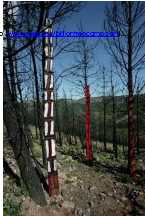
Forêt de la Garde Freinet