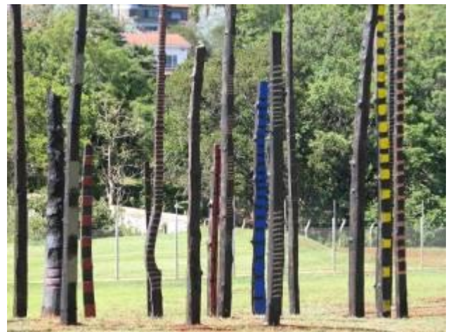
Nairobi, Kenya, Siège des Nations Unies